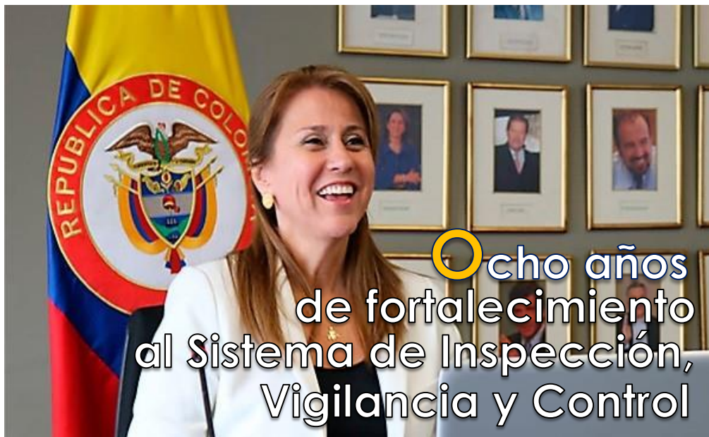
Griselda Janeth Restrepo Gallego - Ministra del Trabajo

En primer lugar es importante señalar que en este Gobierno se creó nuevamente el Ministerio del Trabajo y desde ese momento uno de los pilares de la gestión del mismo ha sido el fortalecimiento de la Inspección del Trabajo, como resultado, se crearon 480 nuevos cargos en la planta de Inspectores de Trabajo, sumando a la fecha un total de 904; pero además los salarios de los Inspectores de Trabajo se ha incrementado un 77% entre 2009 y 2016 y nos encontramos muy cerca de una nueva nivelación salarial para estos con un grado más. Por otro lado, se mejoraron las condiciones de trabajo de los funcionarios con sedes de trabajo apropiadas para sus funciones tanto en el nivel central como en el territorial. Así mismo, destacamos el incremento al presupuesto de inversión destinado a este fortalecimiento pasando de $468 millones en el año 2015 a $8.000 millones en este año 2018. Además, hoy en día tenemos procesos de capacitación continua, se ha incluido la tecnología en los procedimientos de la Inspección del trabajo, se creó la Unidad de Investigaciones Especiales, se diseñó y estructuró la herramienta de los acuerdos de formalización laboral a través del cual se contribuye a la formalidad del país. Hay muchos más logros que destacar,