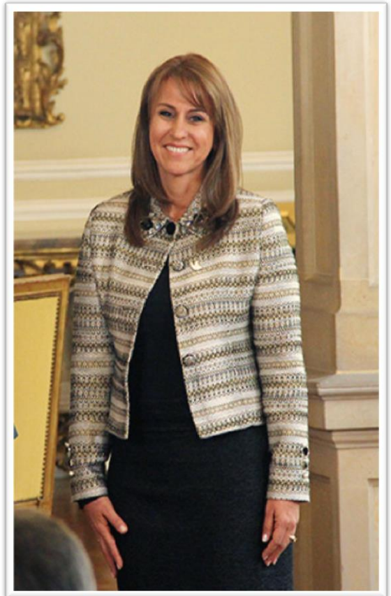
Griselda Janeth Restrepo Gallego Ministra del Trabajo

Lo anterior no significa más, que la voluntad institucional de garantizarles a los trabajadores colombianos los derechos laborales individuales y colectivos a que haya lugar, a través de un Ministerio, cuya vocación esté dirigida exclusivamente a atender los asuntos y apuestas laborales de corto, mediano y largo plazo.