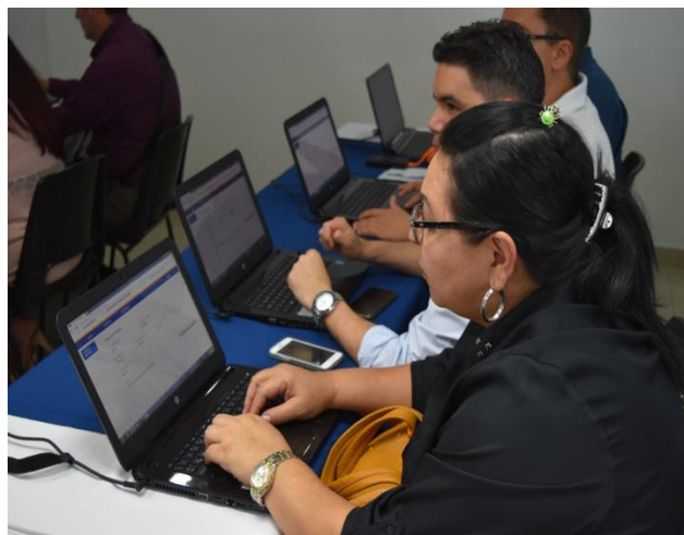
Funcionarios de la Dirección Territorial de Santander reciben capacitación en el uso del Sistema de Información de Inspección, Vigilancia y Control

Como resultado de dicho proyecto, la Organización Internacional del Trabajo y el Ministerio del Trabajo celebraron un Convenio de Cooperación, donde aúnan esfuerzos para diseñar e implementar un Sistema de Información que contenga los módulos del Procedimiento de Averiguación Preliminar y el Procedimiento Administrativo Sancionatorio .