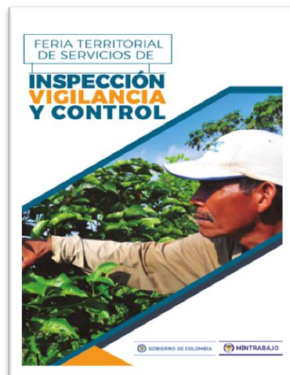
Volante publicitario Ferias Territoriales de Servicios de Inspección, Vigilancia, Control

Estas ferias iniciarán la tercera semana de octubre y los municipios donde inicialmente se realizarán son Pradera, Florida y Candelaria municipios del Valle del Cauca y Puerto Tejada y Corinto en el departamento de Cauca.