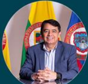
Germán Chamorro de la Rosa Alcalde Municipio de Pasto