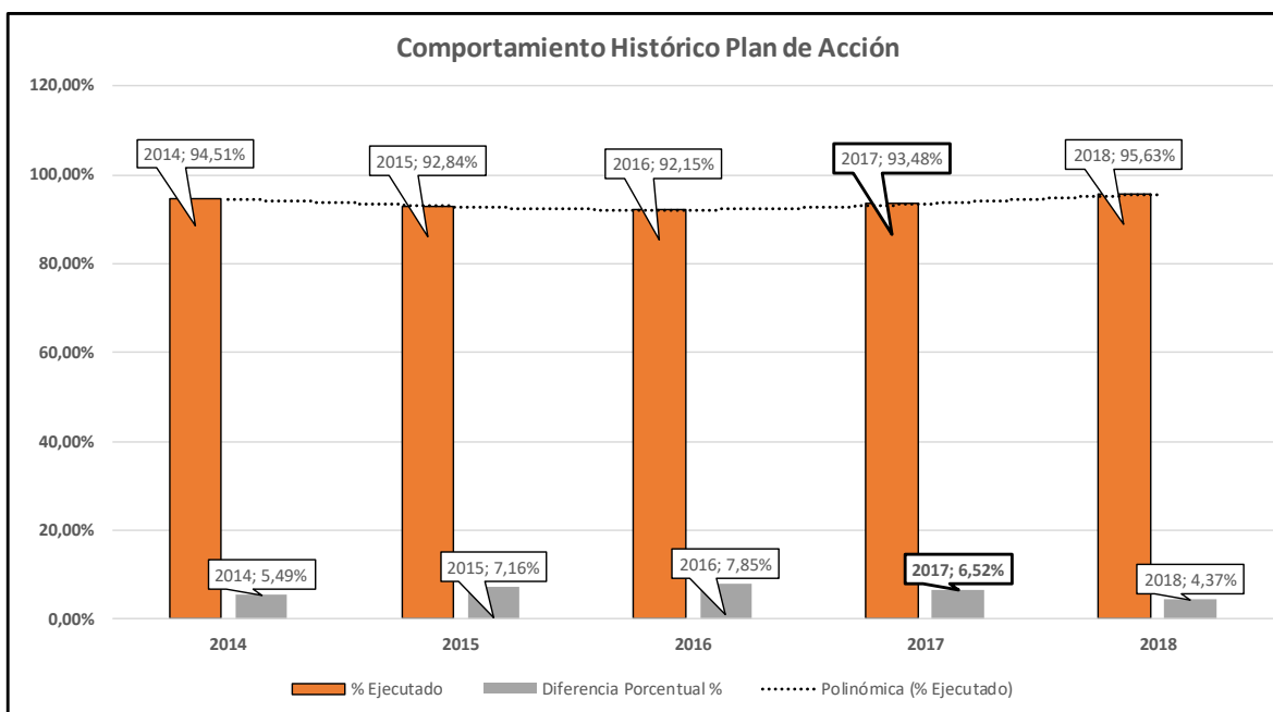
Gráfica 2 Resultados Plan de Acción Vigencias 2014-2018

destacar que el promedio de ejecución anual del Plan de Acción durante los últimos cinco años para el Ministerio del Trabajo da como resultado el 93,72% frente a las metas programadas, detalle en la gráfica No. 2.