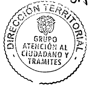
PAOLA PULIDO BAUTISTA