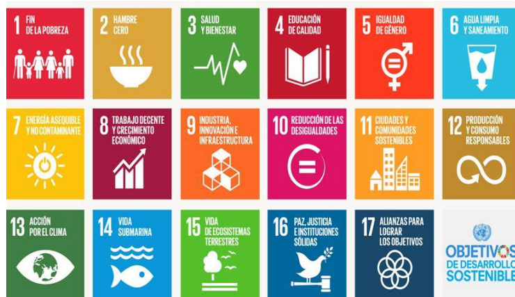
Ilustración 1. Objetivos de Desarrollo Sostenible (ODS)